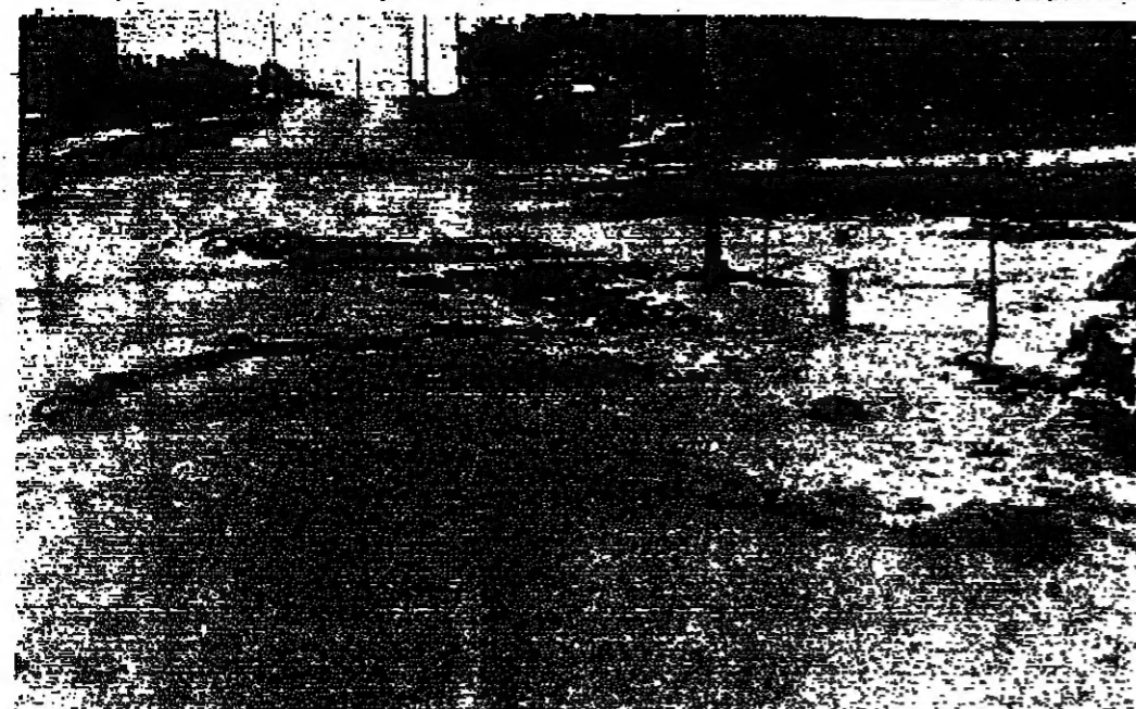
آثرية وحجارة جرتها السيول في بوليفار بجيدا